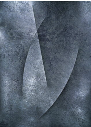
Béatrice Helg (Née en 1956) Résonance VI 2019 Tirage pigmentaire d'archive 160 x 116,7 cm © Béatrice Helg