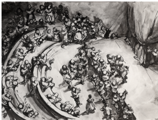
Ofer Josef (Né en 1965) Reminder [Rappel] 2020 Encre sur papier 42 x 59,4 cm Collection particulière