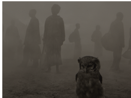
Nick Brandt (Né en 1964) Harriet et personnages dans le brouillard, Zimbabwe [Harriet and People in Fog, Zimbabwe] 2020 Pigment Print on Hahnemühle Museum Etching 350 gsm paper 61 x 82 cm Celso Gonzalez-Falla Collection