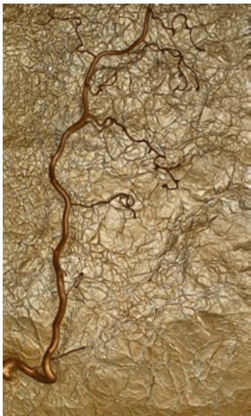
Béatrice Helg (Née en 1956) Natura I 2023 Tirage pigmentaire d'archive 115 x 68,4 cm © Béatrice Helg