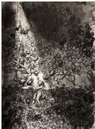
Ofer Josef (Né en 1965) The Skull Juggler [Le Jongleur des crânes] 2020 Encre sur papier 42 x 59,4 cm Collection particulière