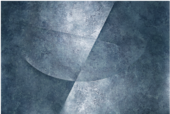
Béatrice Helg (Née en 1956) Résonance XIV 2020 Tirage pigmentaire d'archive 100 x 150,2 cm © Béatrice Helg