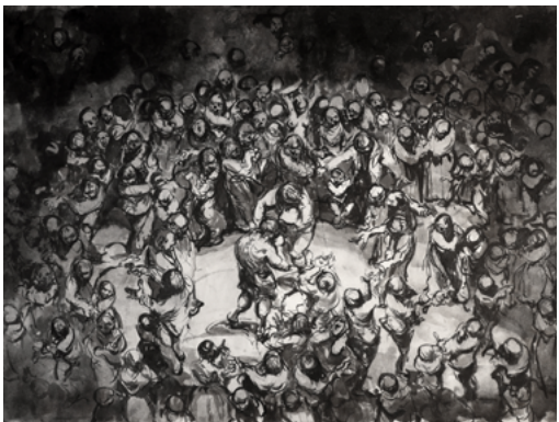
Ofer Josef (Né en 1965) The Ring of the Poor [Le ring des pauvres] 2020 Encre sur papier 59,4 x 42 cm Collection particulière