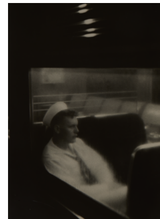
Louis Stettner (1922 – 2016) Penn Station (Marin) [Penn Station (Sailor)] 1998 Épreuve au gélatino-bromure d'argent Gelatin silver print 35,56 x 27,94 cm Estate of Sondra Gilman