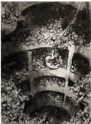
Ofer Josef (Né en 1965) A Trapeze Artist [Un trapéziste] 2021 42 x 59,4 cm Encre sur papier Collection particulière