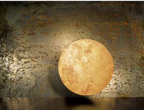
Béatrice Helg (Née en 1956) Cosmos XIV 2016 Tirage pigmentaire d'archive 130 x 163,5 cm