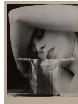
Imogen Cunningham (1883 – 1876) Martha Graham II 1931 Épreuve d'époque au gélatino-bromure d'argent Vintage Gelatin Silver Print 15, 24 x 19,05 cm Gilman & Gonzalez-Falla Arts Foundation