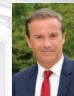
Nicolas Dupont-Aignan Député de l'Essonne Président du fonds de dotation « Les amis de la Propriété Caillebotte »

À l'occasion des journées du patrimoine 2022, nous avons le plaisir de vous convier à l'inauguration tant attendue du parc Budé en centre-ville et aux visites et conférence, qui auront lieu samedi et dimanche après-midi. Grâce à cette restauration, le cœur de notre ville est ainsi magnifié et nous vous invitons à venir découvrir ces nouveaux points de vue.