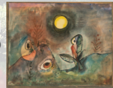
Nocturne, 1958, Aquarelle, 23 x 29 cm, Collection particulière © Jean-Louis Losi

La Maison Caillebotte présente dans l'orangerie une sélection d'œuvres de cet artiste qui a consacré sa vie à la peinture, dans le silence et la discrétion.